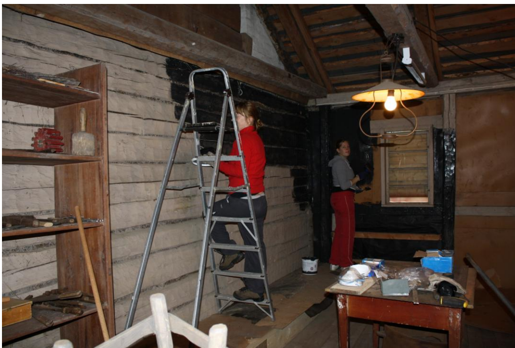
Målning av väggar pågår i "Gjuteriet", en del av Opp-i-bruke utställningen.

Projektunderstöd för Opp-i-bruke II söktes år 2011 från Otto A. Malms understödsfond men erhöles tyvärr inte. Utställningsbygget i lidret framskred trots det med. bl.a. målning av vitrinerna som byggts föregående höst och installation av nya elledningar och armatur. Till sist översattes utställningstexterna och bildförstoringarna hängdes upp. Projektet fick en välvärdig avslutning i maj i samband med att Opp-i-bruke utställningen invigdes.