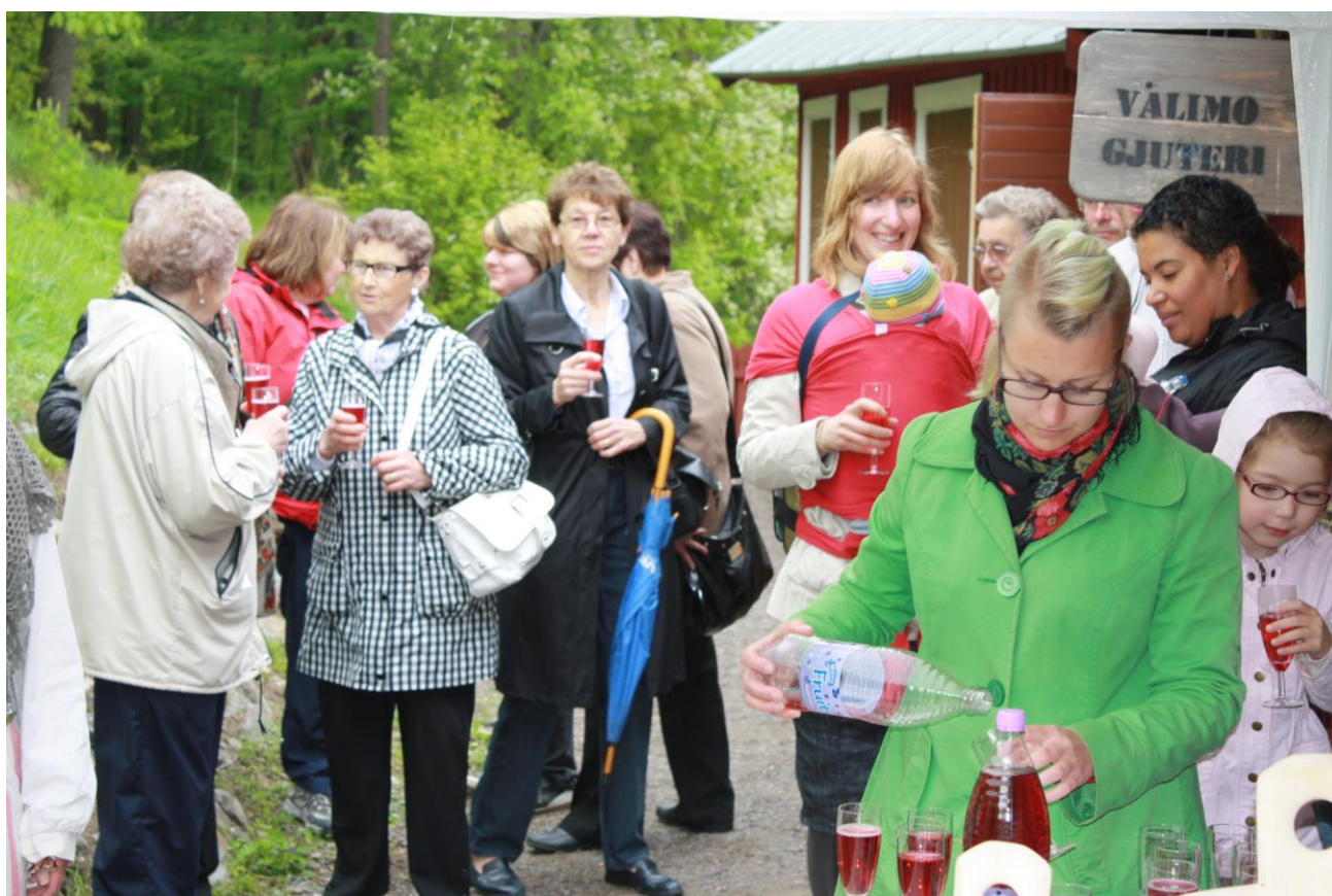
Gäster som inväntar invigningsceremonierna för Opp-i-bruke utställningen.