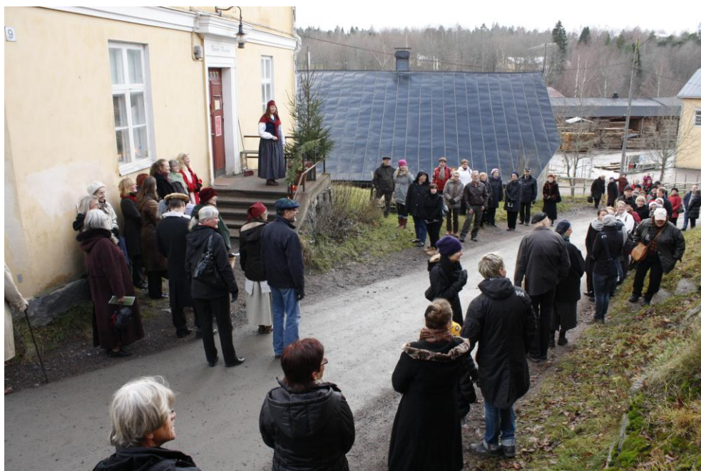
Julinvigningen på museets trappa.

Den 26 november inleddes hela brukets julsäsong med sång och tal vid museets trappa. Under dagen presenterades julutställningen för besökarna och pysselverkstaden i Slaggbyggnaden var öppen. De som hade tur hann också se en glimt av julgubben. Den lyckade julöppningen lockade kring 200 besökare vilket är ett nytt rekord.